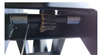
Redutor de Elev. De Mesa