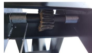
Redutor de Elev. De Mesa