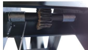
Redutor de Elev. De Mesa