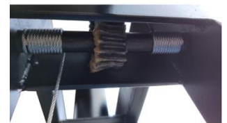
Redutora de Elev. De Mesa