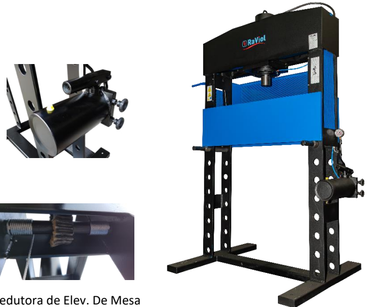
Redutora de Elev. De Mesa

Nota: No modelo PD35 o Pé e a Mesa diferem da imagem. Por favor consulte a ficha técnica dos modelos de 1 velocidade para verificar o respetivo Pé e Mesa.