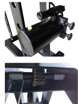
Redutora de Elev. De Mesa