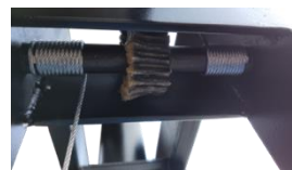
Redutora de Elev. De Mesa