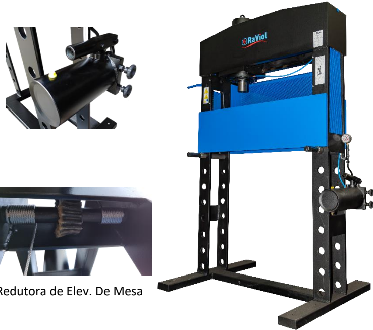
Redutora de Elev. De Mesa

Nota: No modelo PD35M o Pé e a Mesa diferem da imagem. Por favor consulte a ficha técnica dos modelos de 1 velocidade para verificar o respetivo Pé e Mesa.