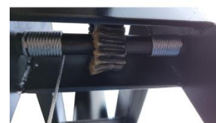
Redutor de Elev. De Mesa