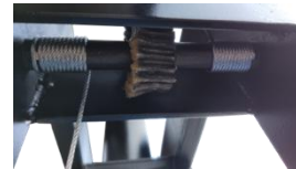
Redutora de Elev. De Mesa