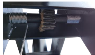
Redutora de Elev. De Mesa